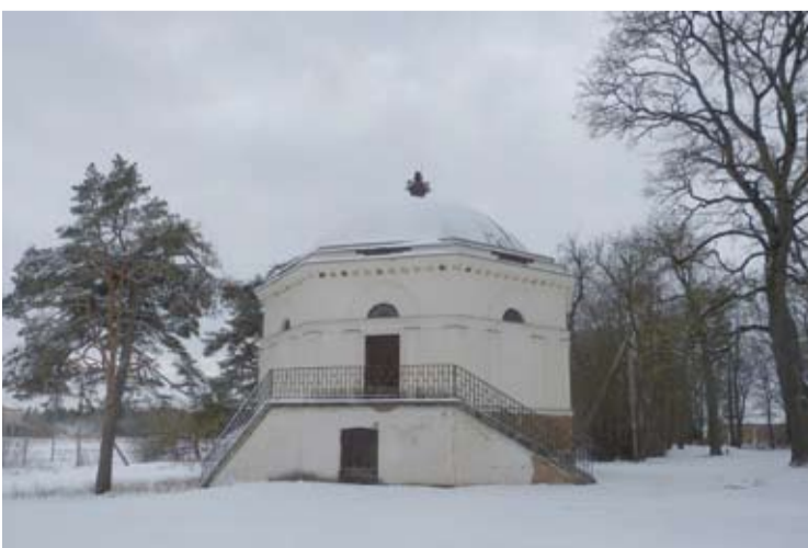
Viename iš Raguvėlės dvaro svirnų apie 2000-uosius buvo įsikūrusi kavinė.