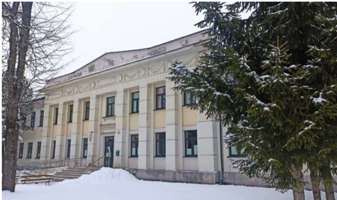
Troškūnų ligoninės pastatas bus perduotas Anykščių senelių globos namams.

Vidmantas ŠMIGELSKAS vidmantas.s@anyksta.lt