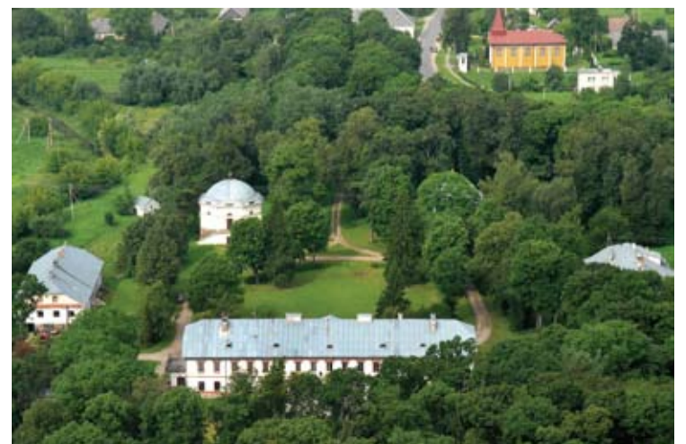
Raguvėlės dvaras vasarą iš paukščio skrydžio.