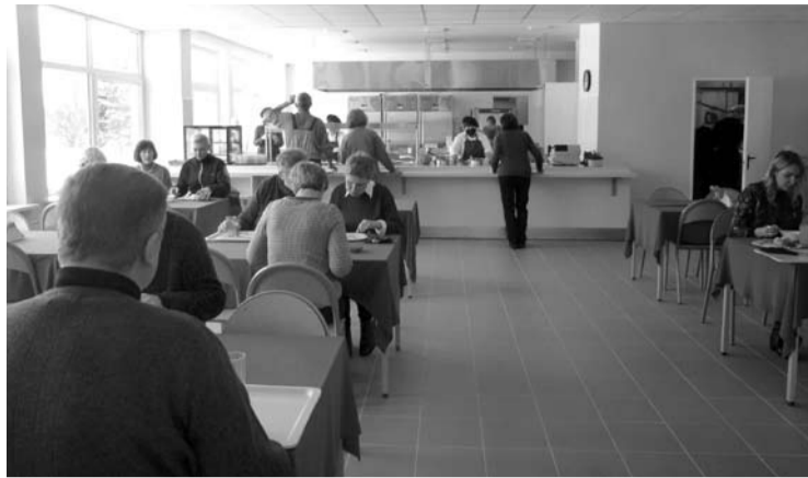
Aukštaitijos profesinio rengimo centro Anykščių filialo valgykloje gali pavalgyti visi išalkusieji.