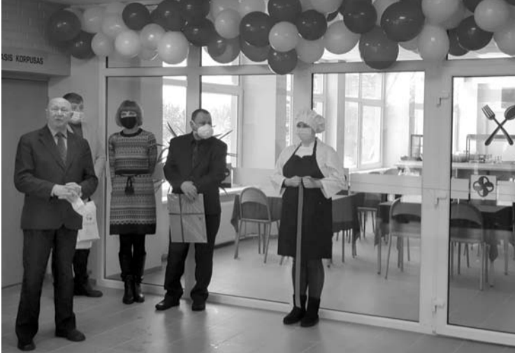
Šią savaitę atidaryta Aukštaitijos profesinio rengimo centro Anykščių filialo valgykla.

Vasario 1-ąją iškilmingai atidaryta Aukštaitijos profesinio rengimo centro Anykščių filialo valgykla. Aukštaitijos profesinio rengimo centro kolektyvo nariai valgykloje mokės tik tiek, kokia patiekalų savikaina, o svečiams bus taikomas 30 proc. antkainis. Bet ir su antkainiu maitintis mokyklos valgykloje bus ypatingai pigu – dviejų eurų pietums garantuotai užteks.