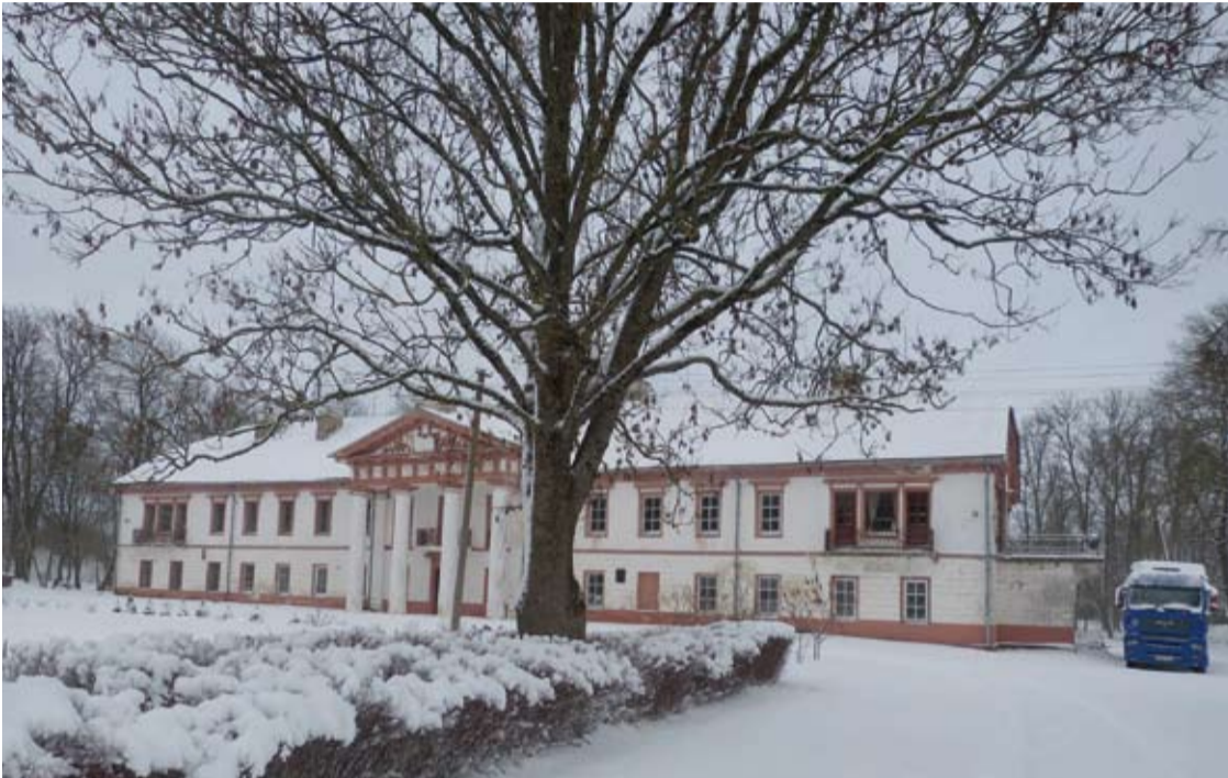
Iki 1998-ųjų Raguvėlės dvaro rūmuose veikė mokykla.

Pastatų komplekso rekonstrukcija ir įveiklinimas, žinia, taip pat kainuos. Ir greičiausiai investicijas derėtų prognozuoti šešių nulių zonoje.