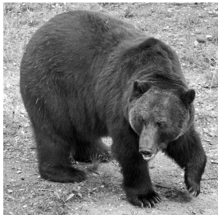
Nors tikimybė Anykščių rajono miškuose sutikti mešką nedidelė, bet egzistuoja - Traupio medžiotojai prieš porą metų bent du kartus fiksavo klajojančią mešką.