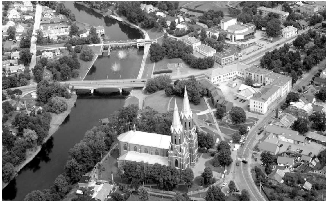
Anykščiai kurorto statuso siekia jau 15-tus metus.