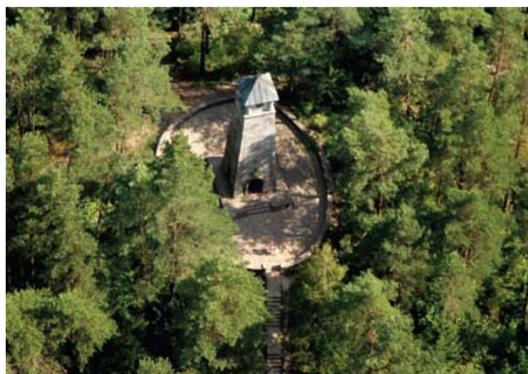
Koncepcijos autorius siūlo medžiais apaugusį Laimės žiburį „išmiškinti“.

Už Anykščių kurortizavimo koncepcijos parengimą Anykščių rajono savivaldybė architektui A.Karaliui sumokėjo 5 tūkst. Eur